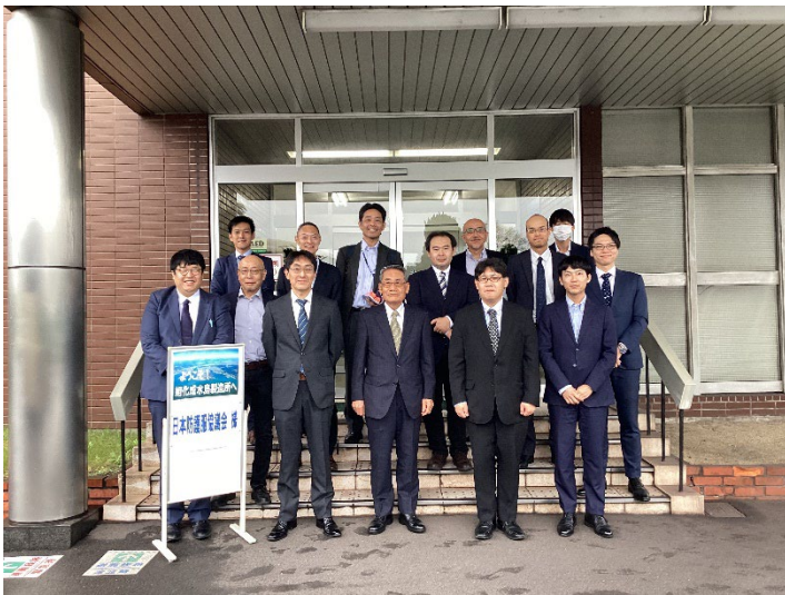
旭化成株式会社 水島製造所にて